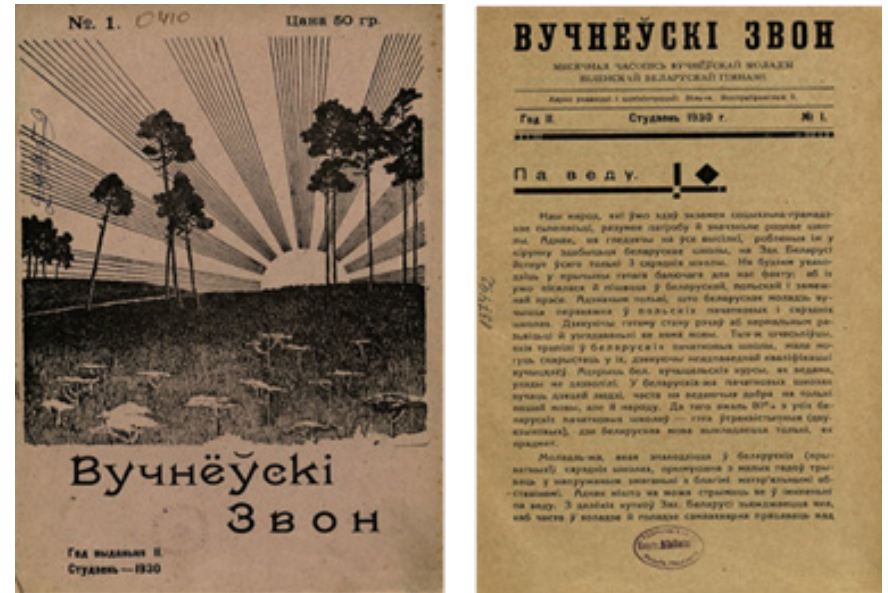
Рис. 1. Журнал «Вучнеўскі звон», г. Вильно, 1930 г.

Попытки создания медиа, рассчитанных на ученическую молодежь, в 1927 г. предприняли учащиеся Виленской белорусской гимназии, выпустив несколько номеров журналов «Напераду» и «Рэха». На регулярной основе организовать издание ученической печати удалось лишь через два года членам гимназического литературно-исторического кружка. В 1929 г. они издали белорусскоязычный ежемесячный журнал «Вучнёўскі звон» (Рис. 1), сформулировав центральную идею СМИ в обращении «Ад рэдакцыі»: «Часопісь для нас мае вялікае значэнне: у ей вучань зможа падзяліцца сваімі думкамі, зможа спрабаваць свае здольнасці на літаратурным попрышчы, зможа ўрэшце навучыцца й узгадоўваць у сабе пачуццё абавязку й салідарнасці» (Вучнеўскі звон, 1929, № 1. С. 2).